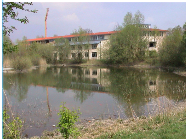
Unser Gymnasium, vom See aus gesehen

Für Beträge bis einschließlich 200 € genügt der Einzahlungsbeleg. Für höhere Zuwendungen erhalten Sie umgehend eine Bescheinigung.