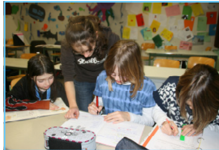
Hausaufgabenbetreuung durch Tutoren

15.00 - Hausaufgabenfertigstellung und evtl. 16.00 Uhr: Lernangebote, Freizeitangebote im sportlichen und kreativen Bereich und pädagogische Betreuung