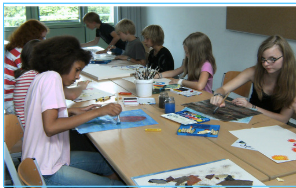
Kreatives Arbeiten und Sportmöglichkeiten

Aus diesen Gründen ist das gemeinsame Mittagessen für alle Schülerinnen und Schüler der Offenen Ganztagschule ein fester Bestandteil des Tagesablaufs, der aus pädagogischen Gründen für alle verbindlich ist. Der Preis ist gegenüber dem normalen Mensaessen reduziert.