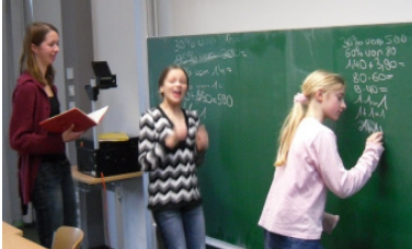
Lernangebot in Kleingruppen

Die Teilnehmer der Ganztagsbetreuung bleiben für das Ergebnis der Hausaufgaben also selbst verantwortlich.